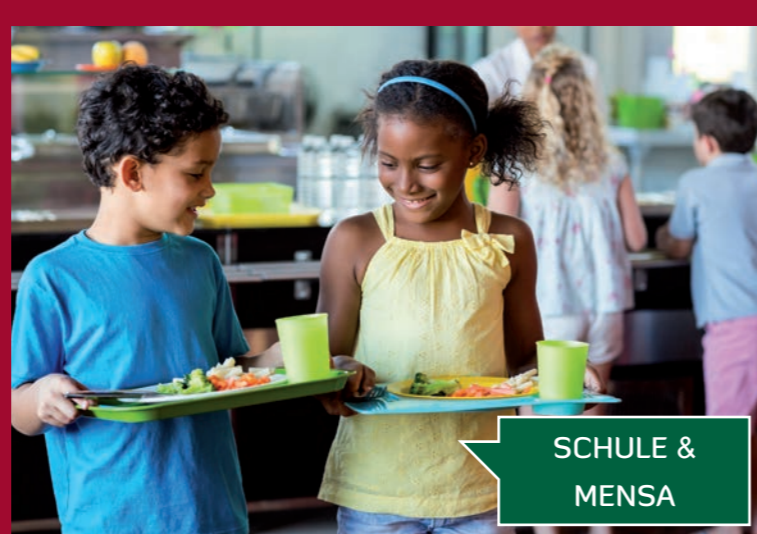
SCHULE & MENSA