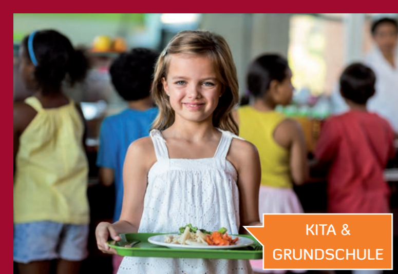
KITA & GRUNDSCHULE