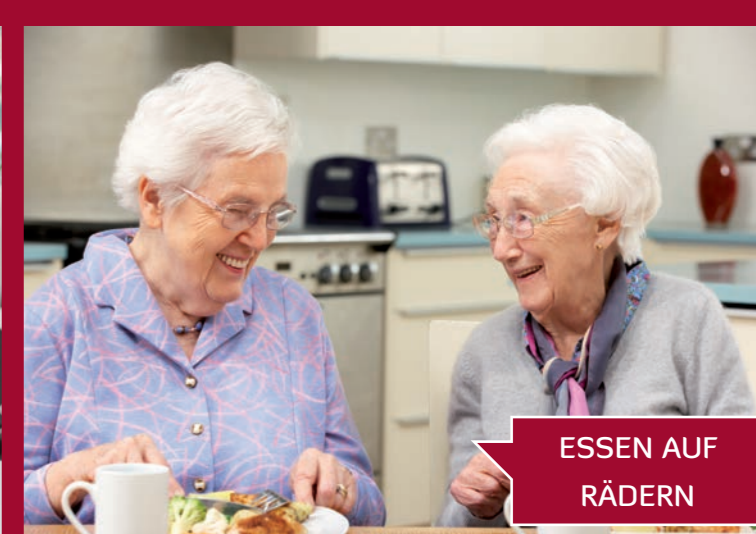
ESSEN AUF RÄDERN